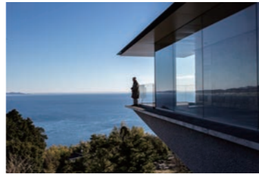
夏至光通拝 100m ギャラリー先端 The tip of the Summer Solstice Observation Gallery