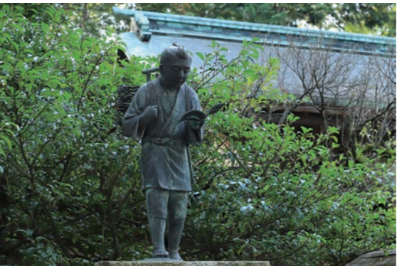
幼少の頃の二宮金次郎像 The statue of young Kinjiro Ninomiya, the famous one.