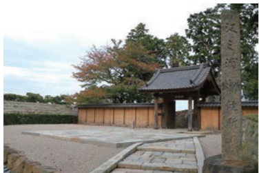
根津美術館から移築された明月門 Meigetsu Gate was relocated from Nezu Museum in Tokyo.