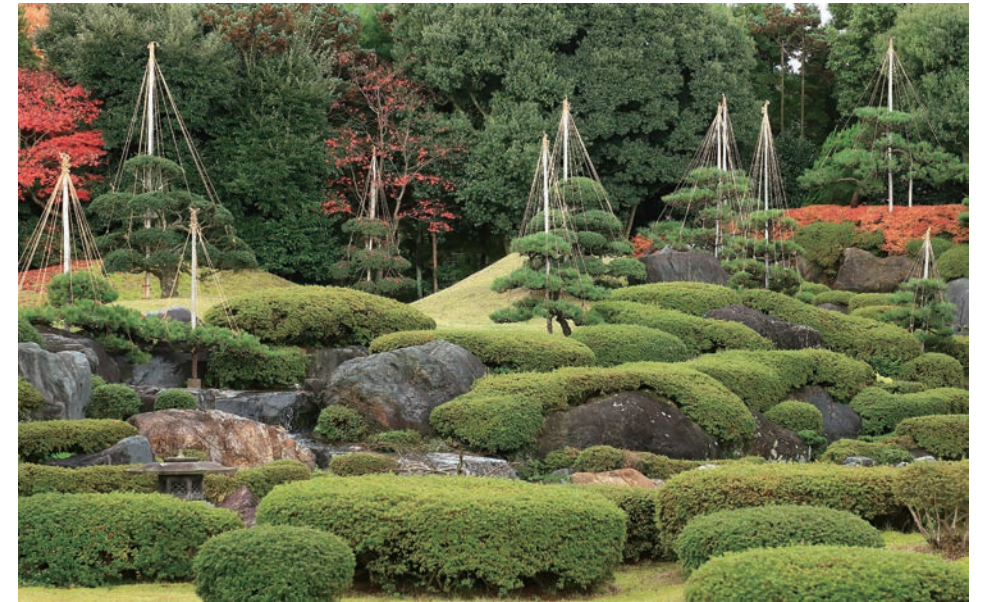
玉翠園 / Gyokusuien

For those who would rather pursue more practical benefits, fresh seafood