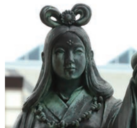
沼河比売（ぬなかわひめ、奴奈川姫）は、高志国（こしのくに、現在の福井県から山形県の一部）を治めていた女神で、出雲の大国主命（おおくにぬしのみこと）から求婚されたと『古事記』に記載がある。

産のヒスイで作られていることが判明した。奈良時代から昭和の初めまで、糸魚川のヒスイは約 1,200 年もの間、歴史の表舞台から姿を消していたが、2016 年にはヒスイが日本の国石に選定されるまでに至った。最初にヒスイが発見された小滝川ヒスイ峡では、昭和 31 年に国の天然記念物に指定されて以降、ヒスイを採集することが禁じられているが、ヒスイ海岸や青海海岸では誰でもヒスイ探しに興じることができる。これらの海岸では、一年を通してヒスイの原石が打ち上げられるが、他所の浜よりも綺麗な石が多いように思えるのは先入観のためだろうか。童心に帰って、海水に濡れてキラキラと光る石をただ拾い集めるもよし。数時間かけてビーチコーミングするもよし。硬度が高いヒスイは削れることなく、角張っていて重いという大人の知識を活用して、本気でヒスイの原石を探すもよし。拾った石をフォッサマグナミュージアムへ持ち込めば、石の鑑定をしてもらうことも可能である。