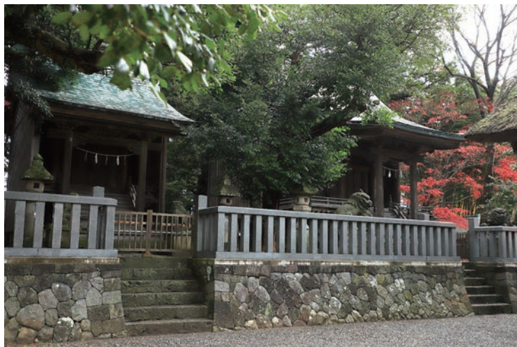
天津神社 新潟県糸魚川市一の宮 1-3-34 Amatsu Jinja (Amatsu Shrine) 1-3-34 Ichinomiya, Itoigawa-shi

「玉」とはヒスイ。「求めて得まし」は「買う」であり、淳名河は産地で、『古事記』に書かれている沼河比売（ぬなかはひめ）のこと。そして沼河比売は、糸魚川周辺で祀られている。この万葉の歌から、糸魚川がヒスイの産地ではなかっただろうかという推理が、松本清張の小説『万葉翡翠』の中で展開されている。事実、昭和 14 年に新潟県姫川上流小滝川辺りでヒスイの原石が見つかり、ミャンマーでしかヒスイは採掘できないと考えられていた当時の定説が覆された。その後研究が進み、日本全国の遺跡から発掘される勾玉の全てが糸魚川